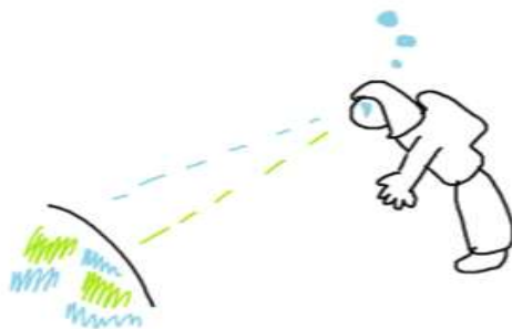
Figure 1. Contemplation de l'astronaute dans l'univers.

Etre seul dans l'univers, coupé du monde extérieur, favorise une introspection constructive. L'homme se recentre sur lui-même parmi les autres et peut pousser sa réflexion vers ses motivations intrinsèques. Ceci lui permet de mieux apprivoiser son corps en mouvement dans l'Espace, par une adaptation du comportement moteur en impesanteur. Son esprit également peut se centrer sur ses propres sensations physiques et psychiques. Etre isolé et confiné dans un vaisseau spatial, réduit le corps à quelques actions motrices et la communication à quelques interactions sociales. Cette réduction de liberté de mouvements, cette réduction des contacts humains peuvent être perçues comme des restrictions sensorielles et des contraintes collectives. La sagesse de l'homme dans ces conditions extrêmes est alors d'explorer au mieux ce qui lui est permis de faire et ce qui lui est donné des autres en découvrant de nouveaux liens avec l'environnement. Dans les études éthologiques du comportement d'équipages multinationaux en milieux confinés et isolés qui simulent un voyage spatial, la diversité culturelle contribue à ces stratégies positives d'adaptation. Les membres d'équipages communiquent, partagent, échangent sur leurs habitudes de vie propres sur Terre. L'expérience des uns apporte de la nouveauté aux autres et la curiosité humaine est ainsi satisfaite dans les limites imposées par la distance de son monde lointain à l'habitat spatial.